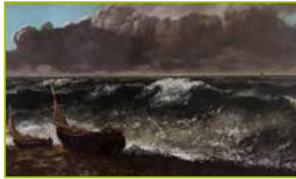
La vague - Gustave Courbet