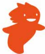
L'icône de Ponyo sur la falaise

Quand vous arrivez sur la plateforme, pour accéder au cahier de notes du film, vous devez cliquer sur l'icône représentant le film ou le chercher dans la liste de films (en haut à droite).