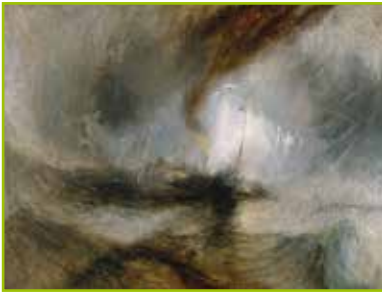
Tempête en mer - Turner

- l'axe de la représentation de l'eau et de la mer d'un point de vue culturel et ethnique. Les représentations japonaises et particulièrement l'occasion de découvrir un très grand artiste de ce pays Hokusai.