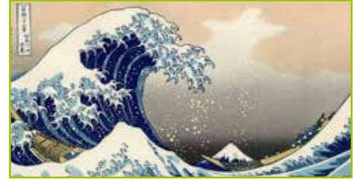
La vague - Hokusai